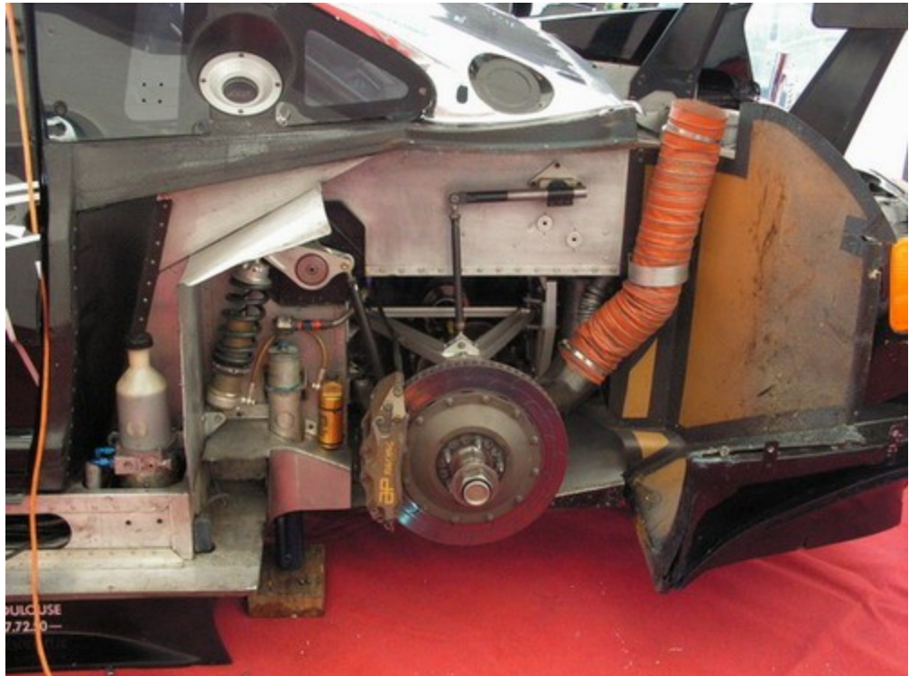
Le train AR doit parler pour les connaisseurs

Sa structure mixte de carbone et d'aluminium en fait une voiture particulièrement rigide : avantage , son comportement sur le sec et sur très bon revêtement. Dans ces conditions, on a affaire à l'efficacité d'un petit proto. les conditions de roulage se gâtent dès que le bitume se transforme en bitume irrégulier : les suspensions particulièrement sèche ne filtre plus rien, c'est alors le corps qui restitue toute l'énergie des accélérations verticales. anecdote : je me suis vu lâcher la pédale d'accélération à plusieurs reprises dans les courbes rapides mais très accidentées alors de DIJON. les acquisitions embraquées le montraient parfaitement , les pics de débattement suspension renvoyés par le capteur de suspension étaient parfaitement synchrones avec les pertes d'ouverture papillon moteur. Autre grief lié à la rigidité châssis et une gamme d'amortisseur et barre anti roulis pas assez étendue : le comportement sous la pluie.